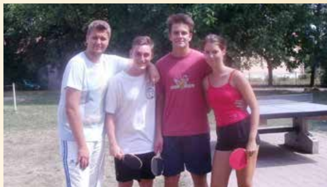
Turnaj ve stolním tenise