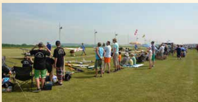
Slet Top modelů