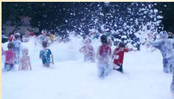
Pěnová atrakce pro děti při hasičských závodech

Po náročném dni děti bez reptání zalezly do stanů a ráno po snídani a nezbytném uklizení prostorů jsme se rozloučili a slíbili si přespaní i v příštím roce.