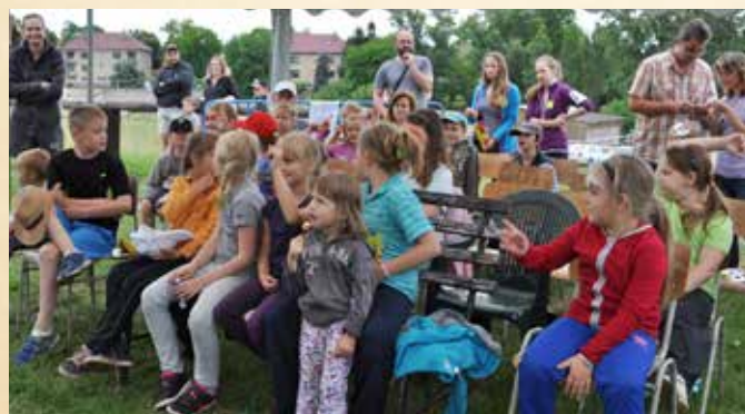
Dětský den na Přitocce