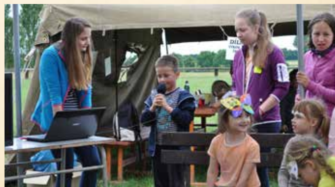
Dětský den na Přitocce