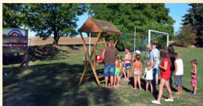
Rozloučení s prázdninami